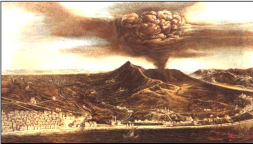
Савремени приказ ерупције Везува 16. децембра 1631. године 13

renti stessi del monte...“. 11 Овакво значење појам лава је задржао све до око средине 18. века, када је први пут употребљена у модерном смислу – да означи изливање потока истопљене, ужарене магме из кратера и пукотина вулканске купе. 12